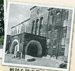
戦跡を残す黒塗りの 六甲台本館(1953年頃)