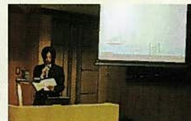
学生による研究発表