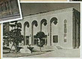
竣工まもなくの神戸商業大学講堂(1937年頃)