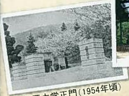
神戸大学正門(1954年頃)