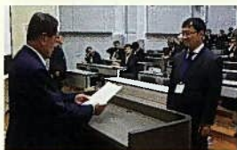
六篠賞授与式の様子